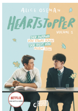
Heartstopper Volume 1