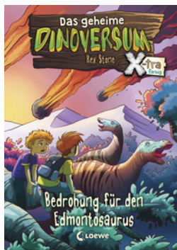
Das geheime Dinoversum Xtra (Band 6) - Bedrohung für den Edmontosaurus