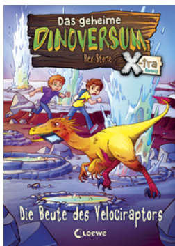
Das geheime Dinoversum Xtra (Band 5) - Die Beute des Velociraptors