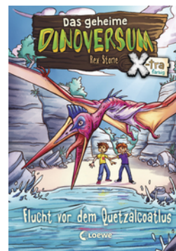
Das geheime Dinoversum Xtra (Band 4) - Flucht vor dem Quetzalcoatlus