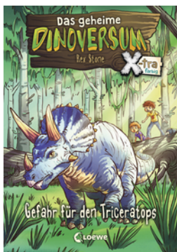
Das geheime Dinoversum Xtra (Band 2) - Gefahr für den Triceratops