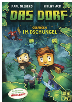
Das Dorf (Band 3) - Gefangen im Dschungel