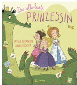
Die allerbeste Prinzessin