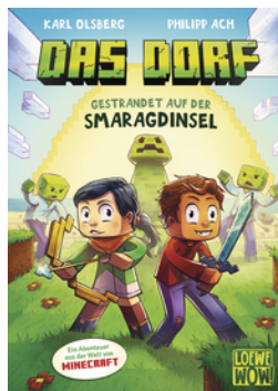
Das Dorf (Band 1) - Gestrandet auf der Smaragdinsel