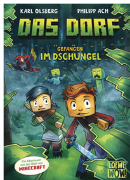
Das Dorf (Band 3) - Gefangen im Dschungel