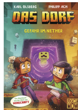
Das Dorf (Band 2) - Gefahr im Nether