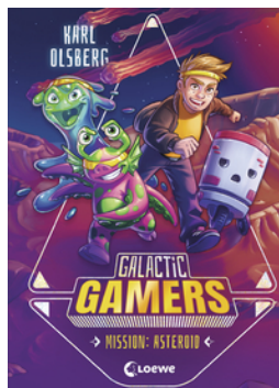
Galactic Gamers (Band 2) - Mission: Asteroid