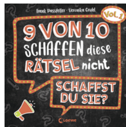
9 von 10 schaffen diese Rätsel nicht - schaffst du sie? - Vol. 1