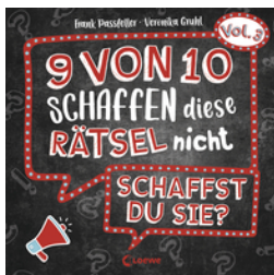
9 von 10 schaffen diese Rätsel nicht - schaffst du sie? - Vol. 3