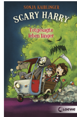
Scary Harry (Band 2) - Totgesagte leben länger