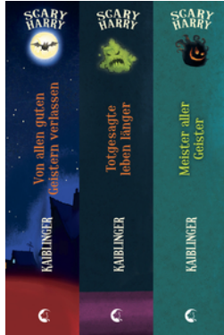
Scary Harry (Band 1-3)