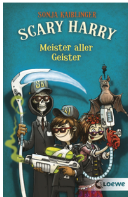
Scary Harry (Band 3) - Meister aller Geister