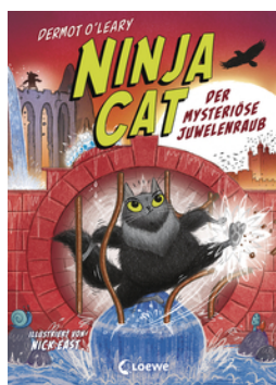
Ninja Cat (Band 4) - Der mysteriöse Juwelenraub