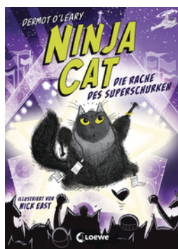
Ninja Cat (Band 3) - Die Rache des Superschurken