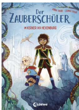
Der Zauberschüler (Band 5) - Im Kerker der Hexenburg