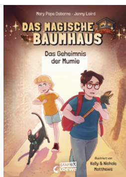
Das magische Baumhaus (Comic-Buchreihe, Band 3) - Das Geheimnis der Mumie