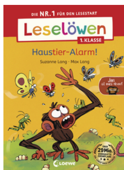
Leselöwen 1. Klasse - Jim ist mies drauf - Haustier-Alarm!