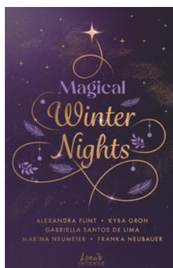
Magical Winter Nights