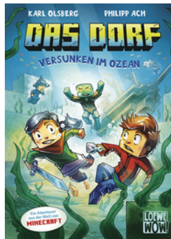
Das Dorf (Band 5) - Versunken im Ozean