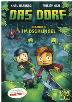
Das Dorf (Band 3) - Gefangen im Dschungel