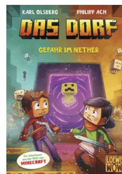
Das Dorf (Band 2) - Gefahr im Nether