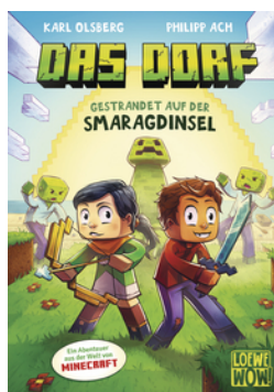
Das Dorf (Band 1) - Gestrandet auf der Smaragdinsel