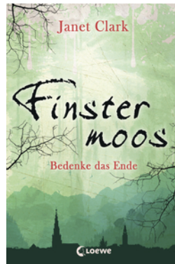
Finstermoos – Bedenke das Ende