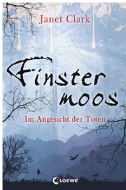
Finstermoos – Im Angesicht der Toten