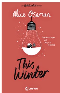
This Winter (deutsche Ausgabe)