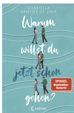
Warum willst du jetzt schon gehen?