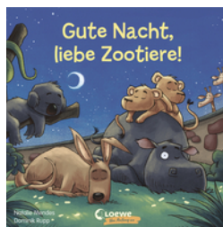
Gute Nacht, liebe Zootiere!