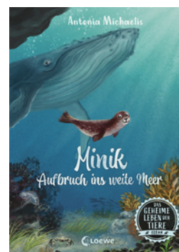
Das geheime Leben der Tiere (Ozean) - Minik - Aufbruch ins weite Meer