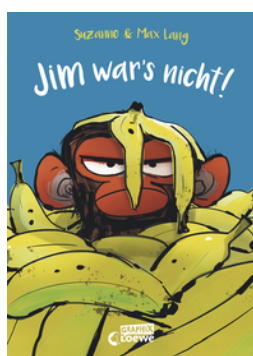
Jim war's nicht!