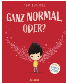
Ganz normal, oder? (Die Reihe der starken Gefühle)