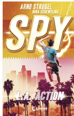
SPY (Band 4) - L.A. Action