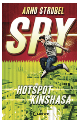
SPY (Band 2) - Hotspot Kinshasa