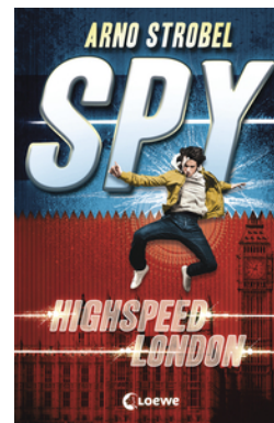
SPY (Band 1) - Highspeed London