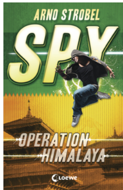
SPY (Band 3) - Operation Himalaya