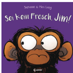
Sei kein Frosch, Jim!