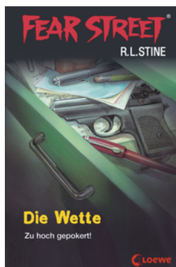
Fear Street 56 - Die Wette