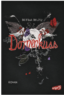
Splitterherz – Dornenkuss