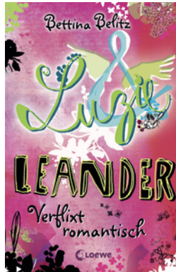
Luzie & Leander - Verflixt romantisch