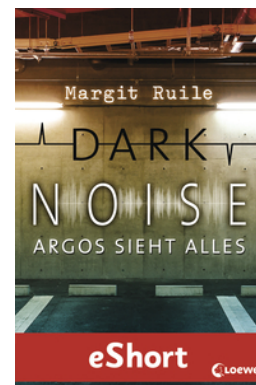
Dark Noise - Argos sieht alles