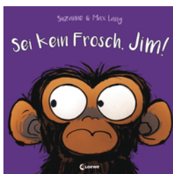
Sei kein Frosch, Jim!