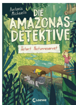
Die Amazonas-Detektive (Band 2) - Tatort Naturreservat