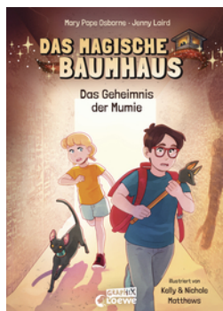
Das magische Baumhaus (Comic-Buchreihe, Band 3) - Das Geheimnis der Mumie