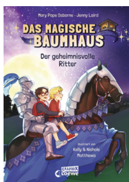
Das magische Baumhaus (Comic-Buchreihe, Band 2) - Der geheimnisvolle Ritter