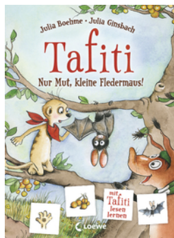
Tafiti - Nur Mut, kleine Fledermaus!