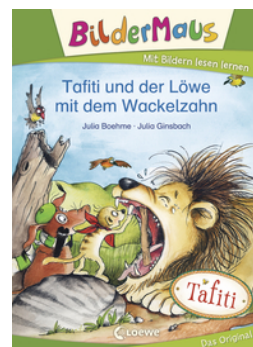
Bildermaus - Tafiti und der Löwe mit dem Wackelzahn