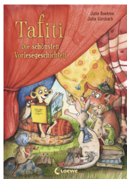
Tafiti - Die schönsten Vorlesegeschichten