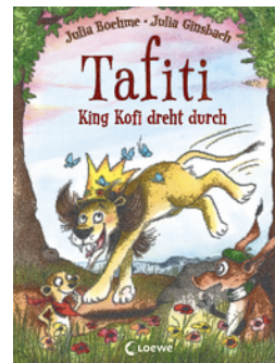
Tafiti - King Kofi dreht durch (Band 21)