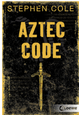
Aztec Code (Band 2)