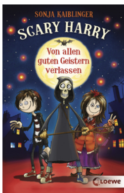
Scary Harry (Band 1) - Von allen guten Geistern verlassen