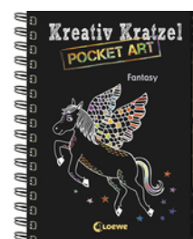
Kreativ-Kratzel Pocket Art: Fantasy