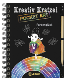
Kreativ-Kratzel Pocket Art: Farbenglück