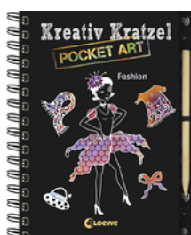
Kreativ-Kratzel Pocket Art: Fashion