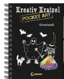
Kreativ-Kratzel Pocket Art: Gruselspaß