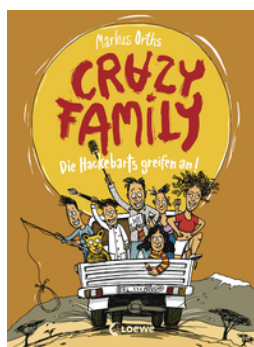
Crazy Family (Band 3) - Die Hackebarts greifen an!