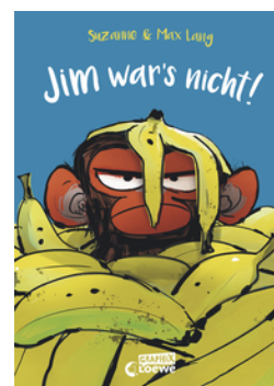
Jim war's nicht!