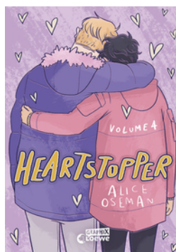
Heartstopper Volume 4 (deutsche Hardcover-Ausgabe)