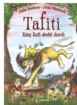
Tafiti - King Kofi dreht durch (Band 21)