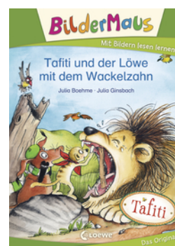
Bildermaus - Tafiti und der Löwe mit dem Wackelzahn