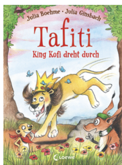
Tafiti - King Kofi dreht durch (Band 21)