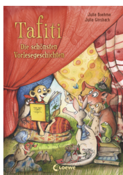
Tafiti - Die schönsten Vorlesegeschichten