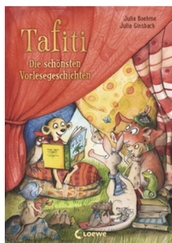
Tafiti - Die schönsten Vorlesegeschichten