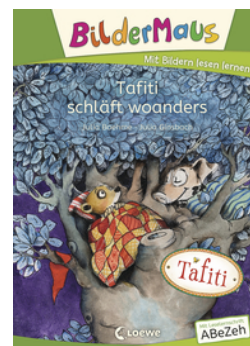
Bildermaus - Tafiti schläft woanders