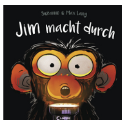
Jim macht durch