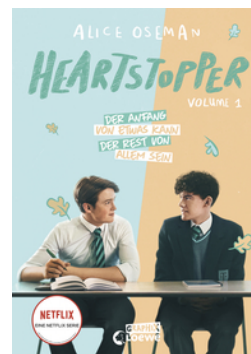
Heartstopper Volume 1