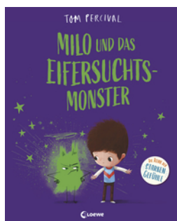
Milo und das Eifersuchtsmonster (Die Reihe der starken Gefühle)