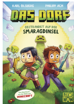
Das Dorf (Band 1) - Gestrandet auf der Smaragdinsel