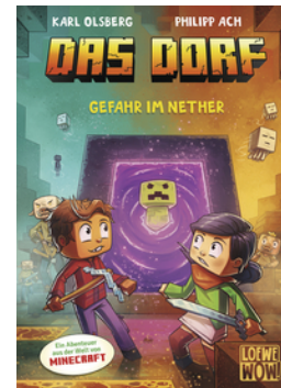
Das Dorf (Band 2) - Gefahr im Nether