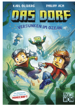
Das Dorf (Band 5) - Versunken im Ozean