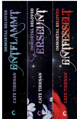
Immortal Beloved – Die komplette Trilogie