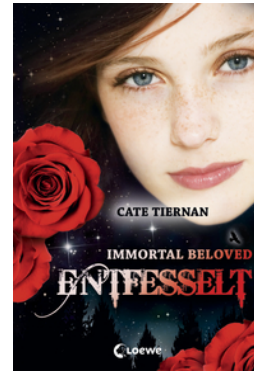
Immortal Beloved (Band 3) – Entfesselt