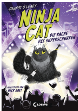
Ninja Cat (Band 3) - Die Rache des Superschurken