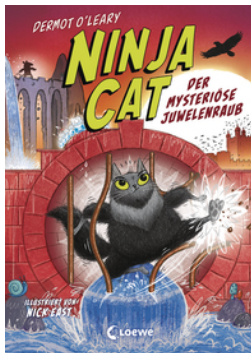
Ninja Cat (Band 4) - Der mysteriöse Juwelenraub