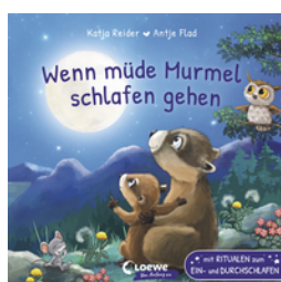
Wenn müde Murrel schlafen gehen