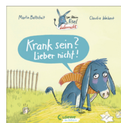
Der kleine Esel Liebernicht - Krank sein? Lieber nicht!