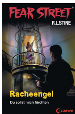
Fear Street 60 - Racheengel