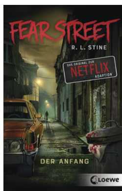
Fear Street - Der Anfang