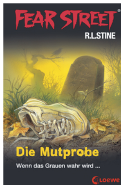
Fear Street 58 - Die Mutprobe