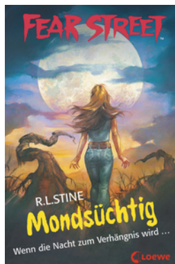
Fear Street 57 - Mondsüchtig