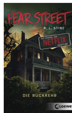
Fear Street - Die Rückkehr