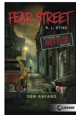
Fear Street - Der Anfang