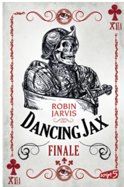
Dancing Jax – Finale