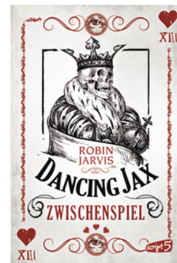
Dancing Jax – Zwischenspiel