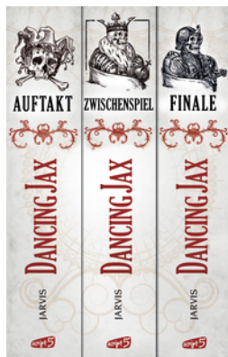
Dancing Jax - Die komplette Trilogie