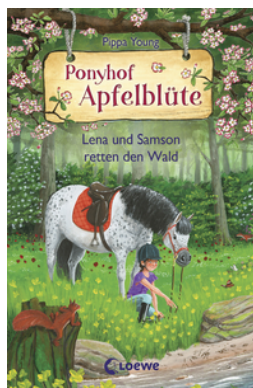
Ponyhof Apfelblüte (Band 22) - Lena und Samson retten den Wald