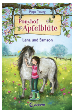
Ponyhof Apfelblüte (Band 1) - Lena und Samson