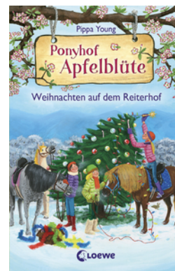
Ponyhof Apfelblüte - Weihnachten auf dem Reiterhof