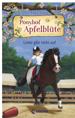
Ponyhof Apfelblüte (Band 23) - Lotte gibt nicht auf